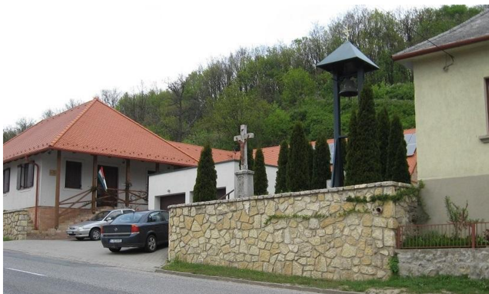
Az érintett telekrész a Veszprémi utca északi tartománya felőli nézete