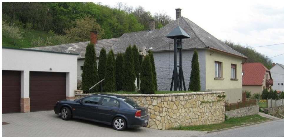
Az érintett telekrész a Veszprémi utca északi tartománya felőli nézete

A módosítással érintett terület alábbi fotói a fent leírt meglévő állapotot támasztják alá: