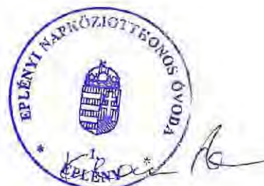
Klausz Éva óvodavezető